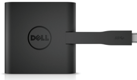
DELL ADAPTER | USB-C TO HDMI/VGA/ ETHERNET/USB 3.0 | DA200

Even when you're not near an outlet, you'll have enough power for your laptop and cell phone with the Dell Power Companion.