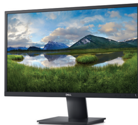
DELL 24 MONITOR | E2420H

Work at full speed with Dell's powerful USB-C dock. Charge your system faster, support up to two displays and connect to your peripherals via a single cable.