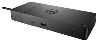
DELL DOCK | WD19

Work at full speed with Dell's powerful USB-C dock. Charge your system faster, support up to two displays and connect to your peripherals via a single cable.