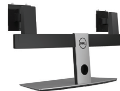
DELL DUAL MONITOR STAND | MDS19

Hear every word clearly on your next call with the Dell Pro Stereo Headset, optimized to provide in-person call quality.