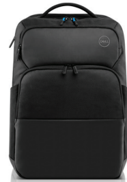
DELL PRO BACKPACK 15 | PO1520P

Use this compact USB-C adapter to connect to any external display which supports VGA or HDMI inputs.