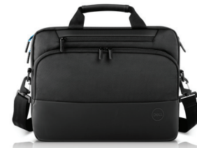
DELL PRO BRIEFCASE 14 & 15 | PO1420C & PO1520C

Work seamlessly with dual mode connectivity (2.4GHz wireless or Bluetooth) and 36 months 20 of battery life.