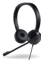
DELL PRO STEREO HEADSET | UC350

With a compact size and full-size keys for accurate typing, this combo offers the convenience of wireless and clutter-free performance when you are back at your desk.