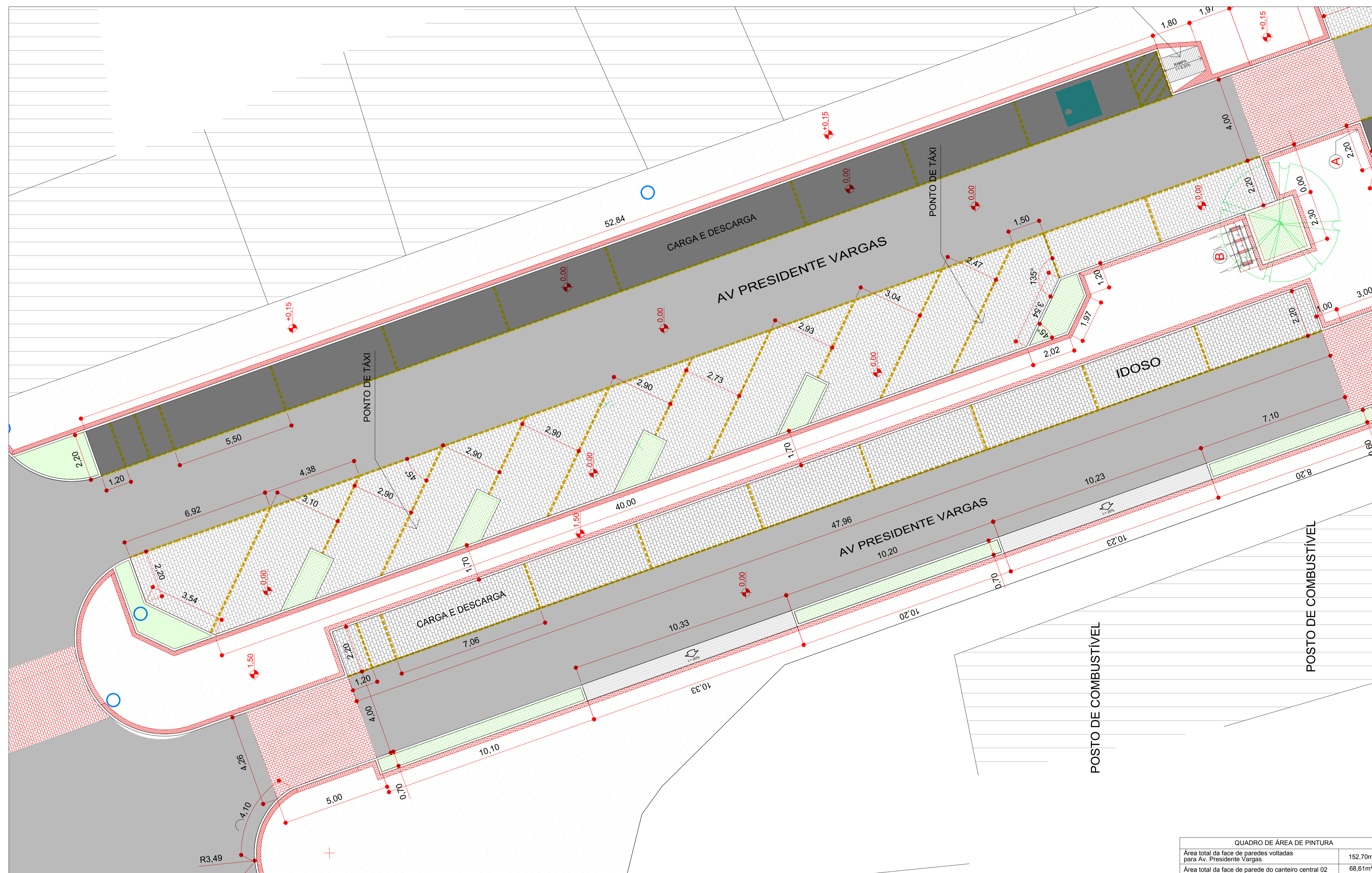
CANTEIRO CENTRAL 02 ESCALA 1:100