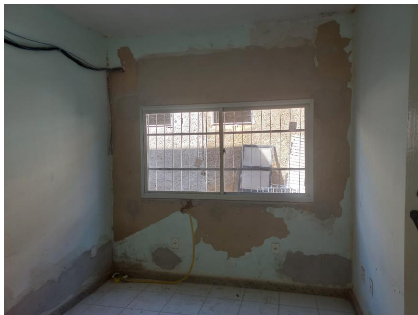
Imagem 11: instalação de janelas