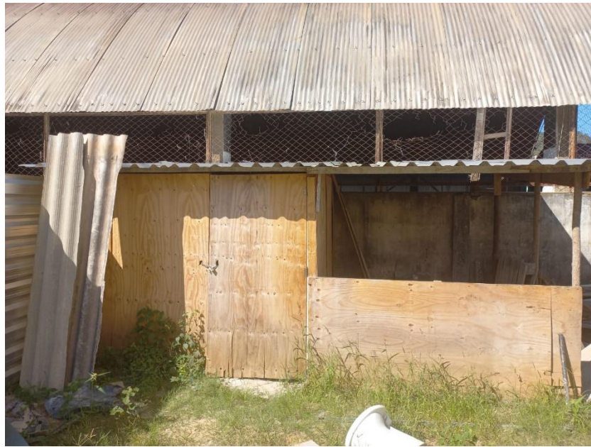
Imagem 05: Barracão de madeira

Contrato: 026/2023 – Período Medido: 31/03/2024 a 03/07/2024