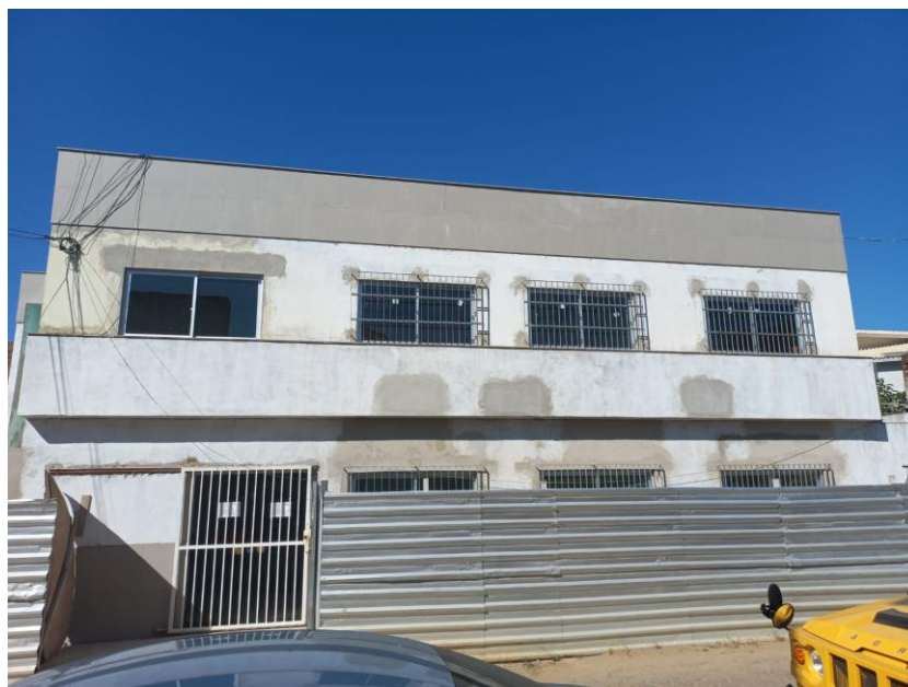
Imagem 13: instalação de janelas