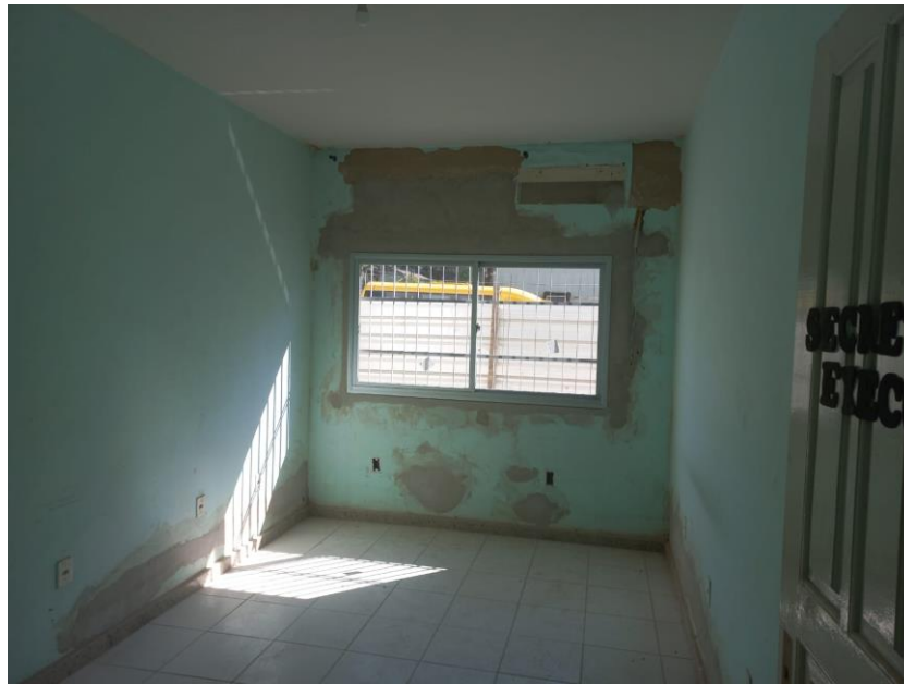
Imagem 15: instalação de janelas

Contrato: 026/2023 – Período Medido: 31/03/2024 a 03/07/2024