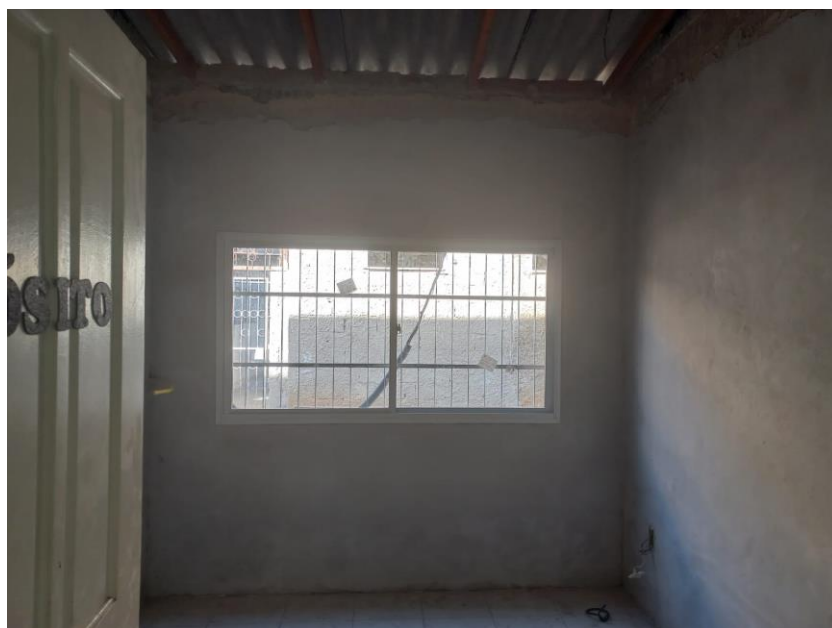
Imagem 06: instalação de janelas