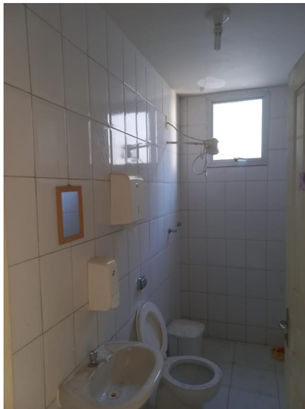
Imagem 08: instalação de bascula e cerâmica

Contrato: 026/2023 – Período Medido: 31/03/2024 a 03/07/2024