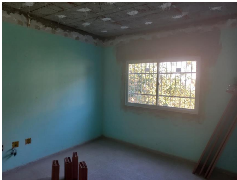
Imagem 03: instalação de janelas

Contrato: 026/2023 – Período Medido: 31/03/2024 a 03/07/2024