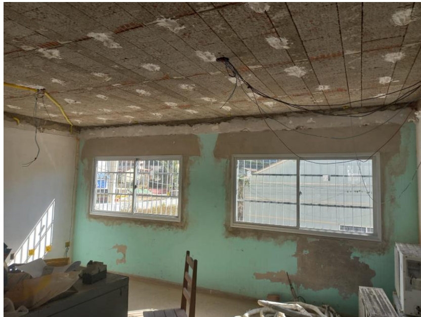
Imagem 01: instalação de janelas

Contrato: 026/2023 – Período Medido: 31/03/2024 a 03/07/2024