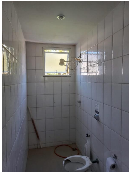
Imagem 02: instalação de bascula e cerâmica