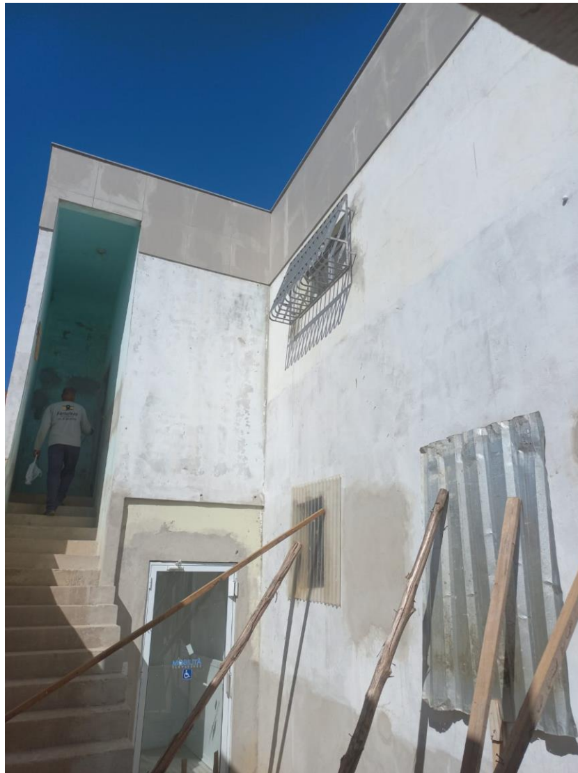
Imagem 04: instalação de cerâmica

Contrato: 026/2023 – Período Medido: 31/03/2024 a 03/07/2024