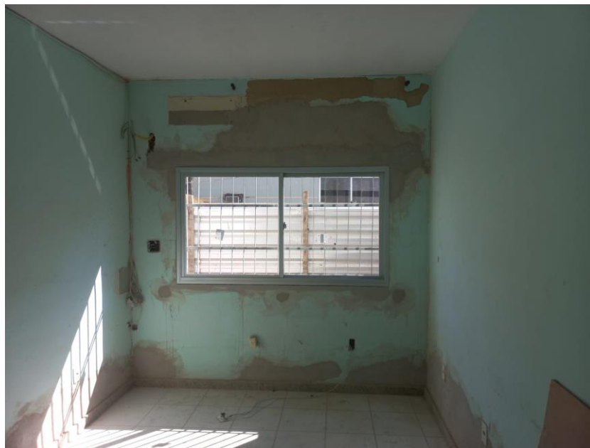
Imagem 12: instalação de janelas

Contrato: 026/2023 – Período Medido: 31/03/2024 a 03/07/2024