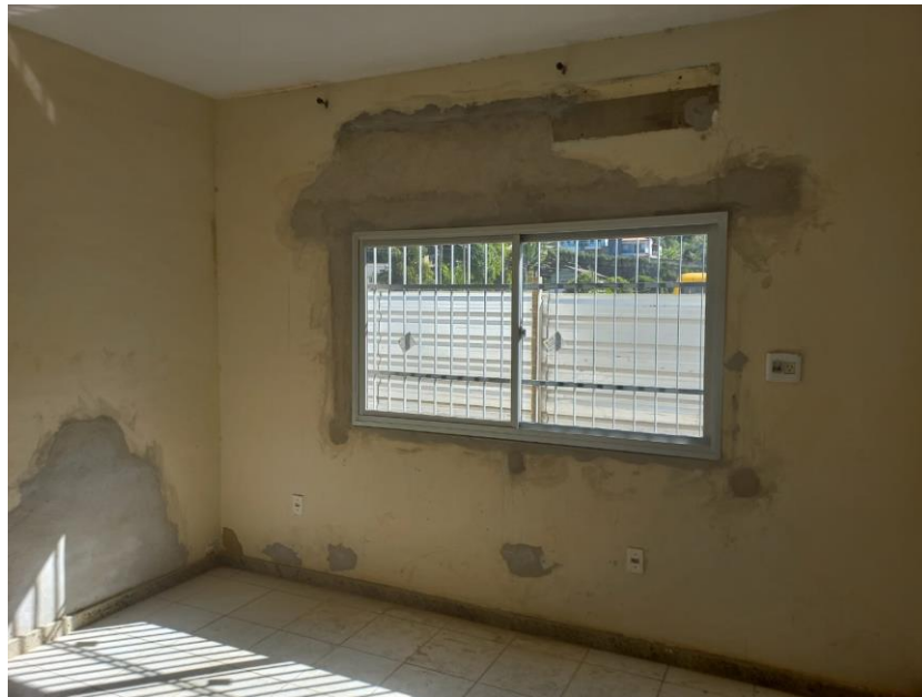
Imagem 10: instalação de janelas

Contrato: 026/2023 – Período Medido: 31/03/2024 a 03/07/2024