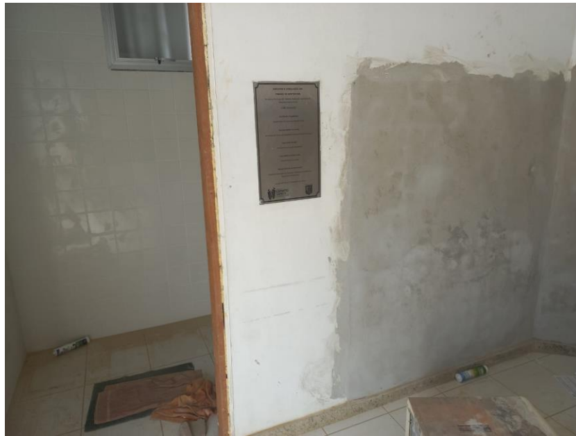
Imagem 07: reboco

Contrato: 026/2023 – Período Medido: 31/03/2024 a 03/07/2024