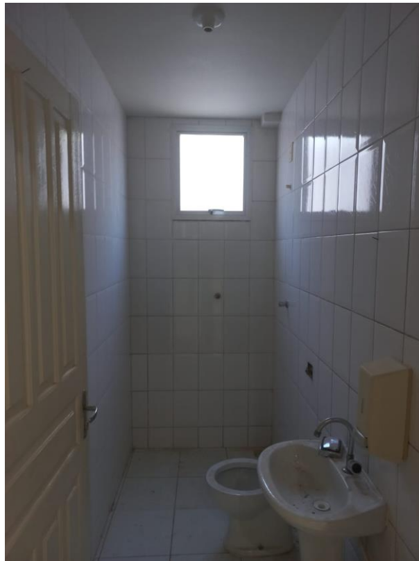
Imagem 09: instalação de bascula e cerâmica

Contrato: 026/2023 – Período Medido: 31/03/2024 a 03/07/2024