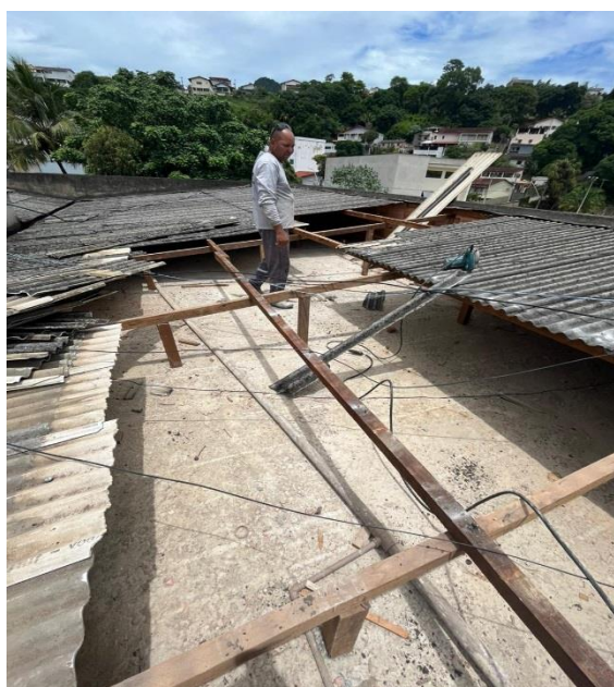
Demolição de telhado e troca de madeiras e telhas