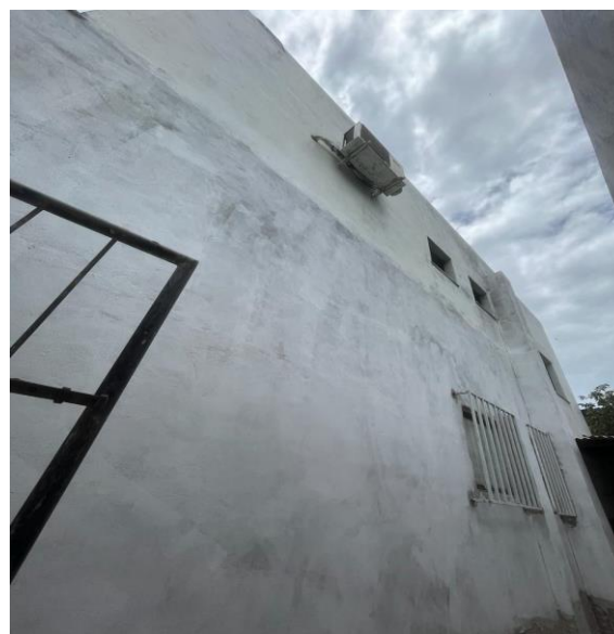
Pintura da fachada