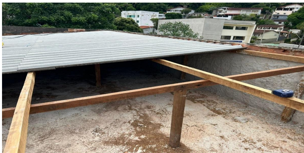
Demolição de telhado e troca de madeiras e telhas

Contrato: 026/2023 – Período Medido: 01/12/2023 a 31/01/2024