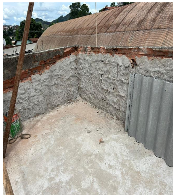
Demolição de telhado e troca de madeiras e telhas