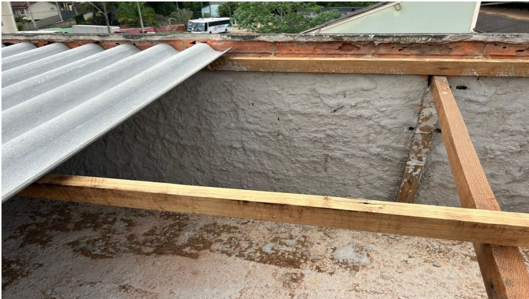
Demolição de telhado e troca de madeiras e telhas

Contrato: 026/2023 – Período Medido: 01/12/2023 a 31/01/2024