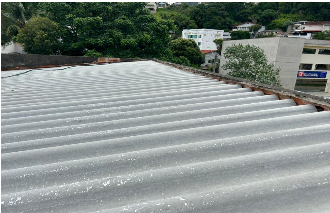
Instalação de Novas telhas