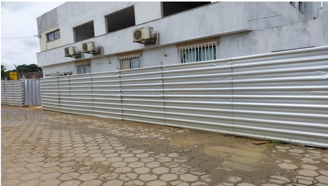
Tapume com telha metálica