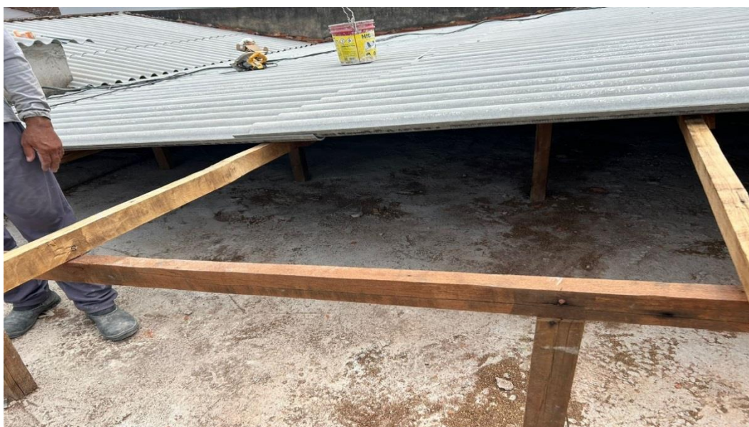
Demolição de telhado e troca de madeiras e telhas