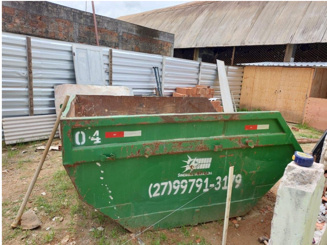
Índice do Conama.

Contrato: 026/2023 – Período Medido: 01/12/2023 a 31/01/2024