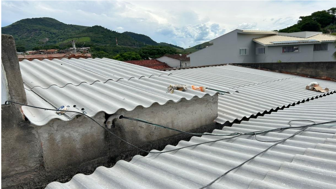
Instalação de Novas telhas

Contrato: 026/2023 – Período Medido: 01/12/2023 a 31/01/2024