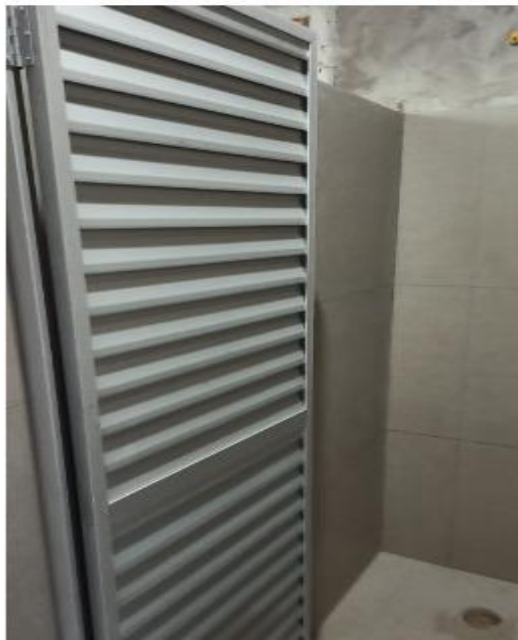
Porta de abrir veneziana

Contrato: 027/2023 – Período Medido: 01/02/2024 a 29/02/2024