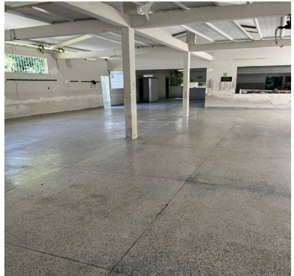
Piso granilitti executado