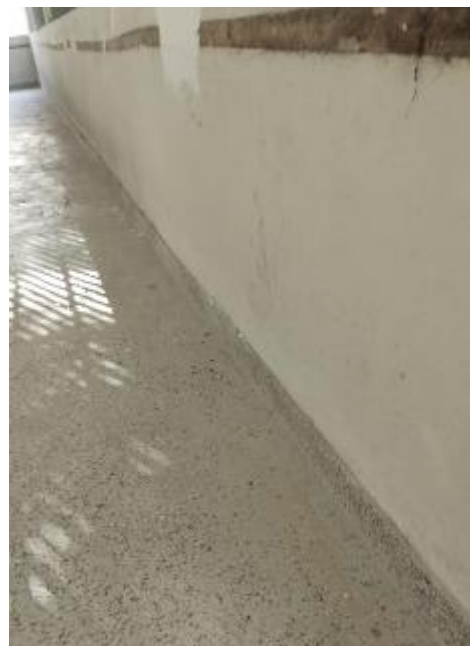
Roda pé de graniliti