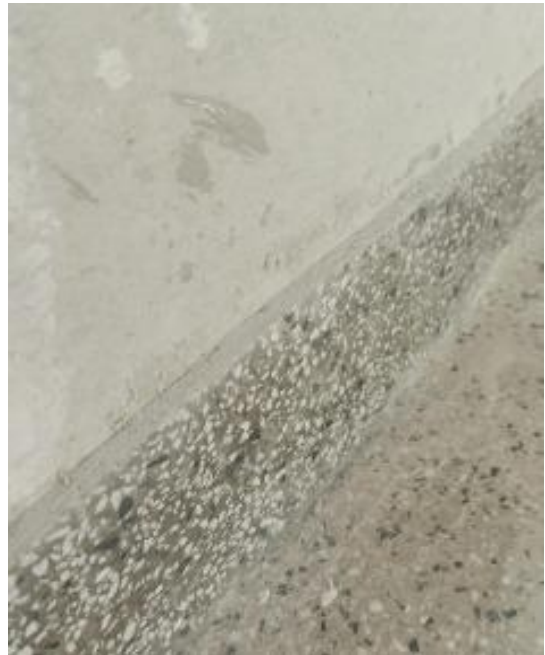
Roda pé de graniliti