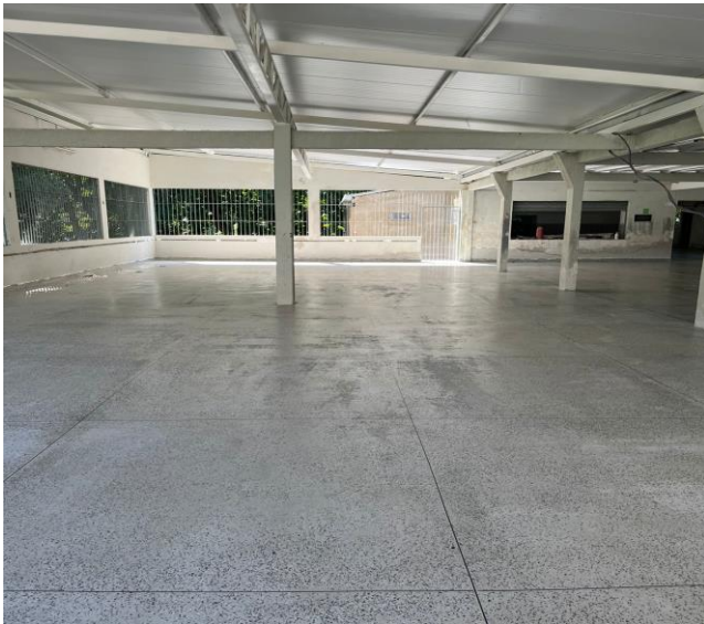
Piso granilitti executado

Contrato: 027/2023 – Período Medido: 01/02/2024 a 29/02/2024